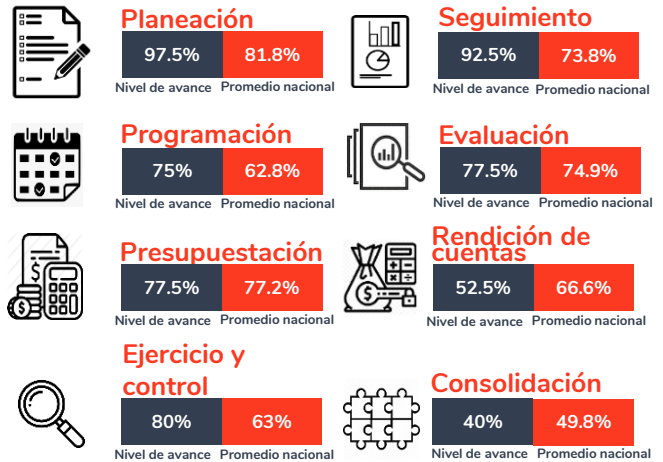
Tabla 1. Resultados del diagnóstico por sección en el estado de Colima, 2020